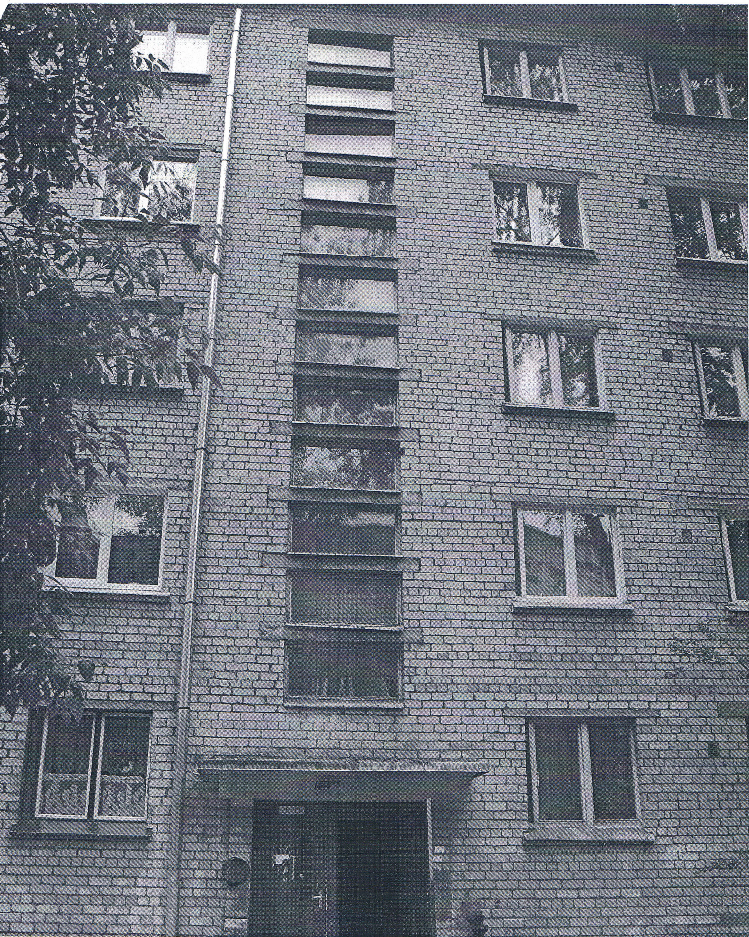
Šaurā ielā 25