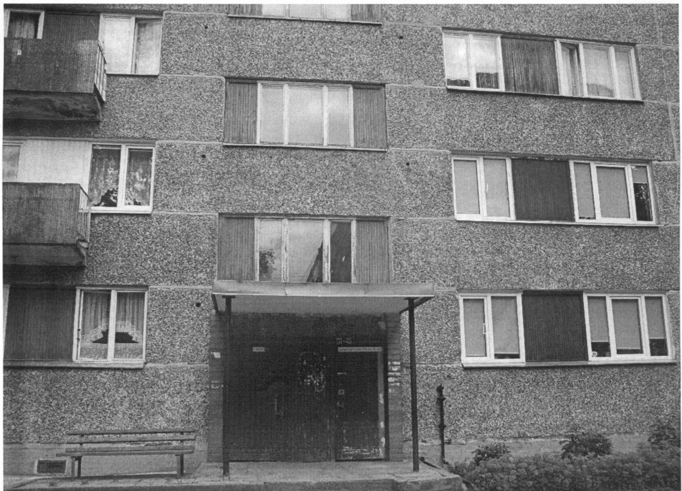
Strādnieku ielā 109.