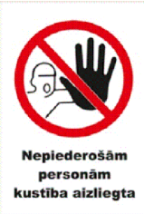
Aizlieguma zīme Nr.2.6.**

Par nepiederošo personu tiek uzskatīta ikviens persona, kura nav saistīta ar būvuzņēmēju ar darbuzņēmuma līgumu, neattiecas pie Pasūtītāja speciālistiem, ne norikots būvuzraugs. Nepiederošo personu piekļūšana būvobjektā ir iespējama tikai ar atbildīga būvdarbu vadītāja vai projekta izpildes koordinators atļauju, pārvietošana būvobjektā ir iespējama tikai ar pavadības personu (personām) un jābūt apģērbti individuālie aizsardzības līdzekļi.