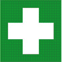
Primāras palīdzības zīme Nr.8.1.**

Uzlīmēt zīmes uz durvīm un jumta noteiktajā vietā, kur tiks izvietoti ugunsdzēsamais aparāts un aptieciņa.